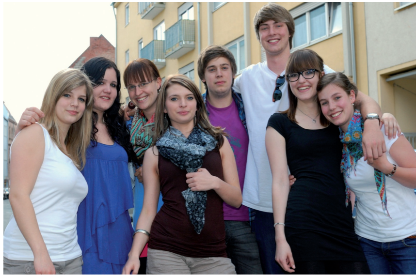
Bewohnerinnen und Bewohner eines Kolping Jugendwohnheims

Der Modellversuch „Ausbildung in Vielfalt“ verfolgt als Teil des Modellversuchsförderungsschwerpunkts „Neue Wege in die duale Ausbildung - Heterogenität als Chance für die Fachkräftesicherung“ des BIBB neue, innovative Ansätze zur Unterstützung des Ausbildungserfolgs von kleinen und mittleren Unternehmen (KMU). Unternehmerstammtische, initiiert von Jugendwohnheimen, sind eine gute Möglichkeit, die wohnheimspezifischen Unterstützungsangebote für junge Menschen und Unternehmen darzustellen und haben zum Ziel, langfristige wirtschaftliche Vernetzungen vor Ort zu gestalten, zu fördern und somit zur Fachkräftesicherung beizutragen.